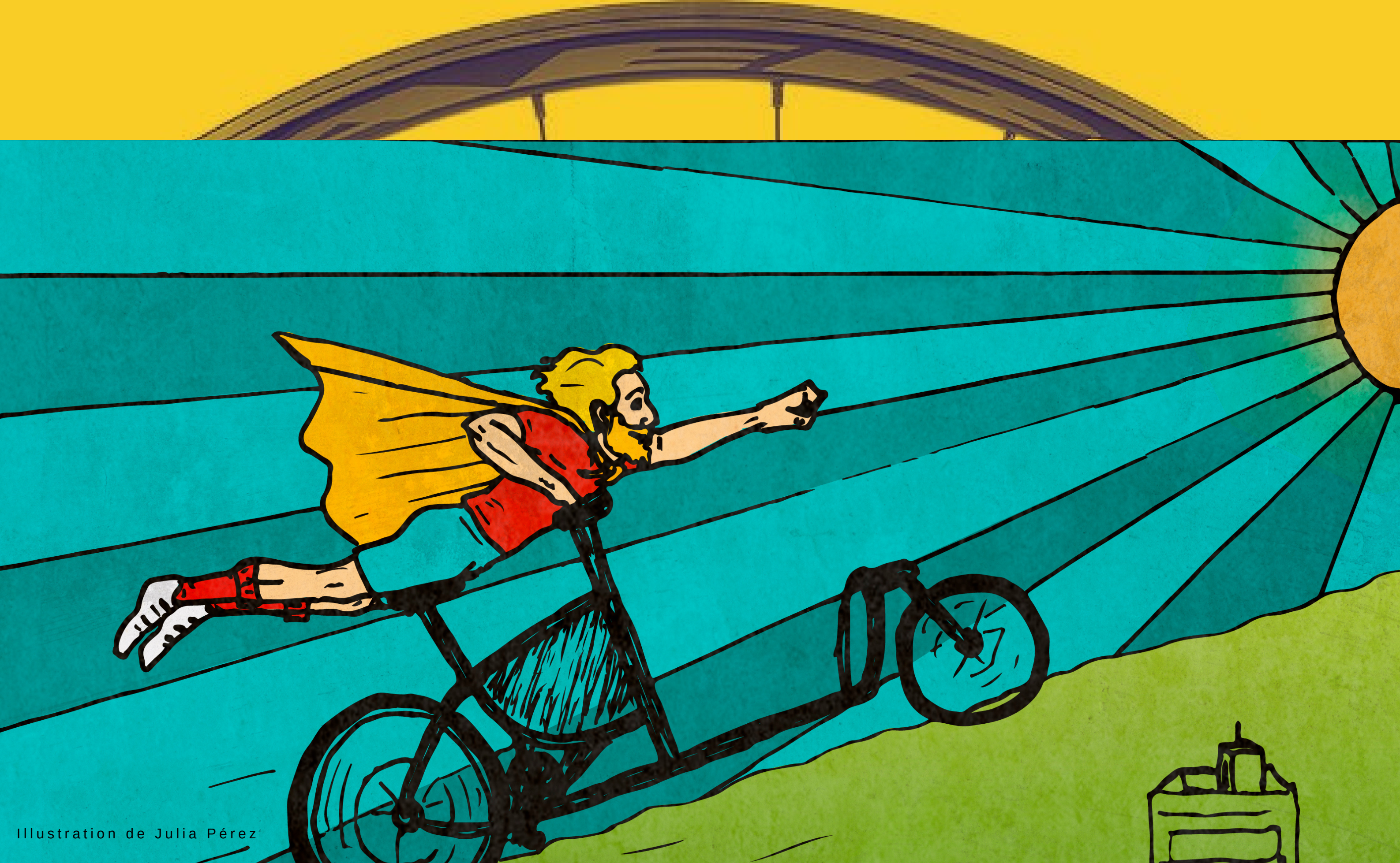
Illustration de Julia Pérez